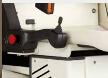
Manette de commande intégrée