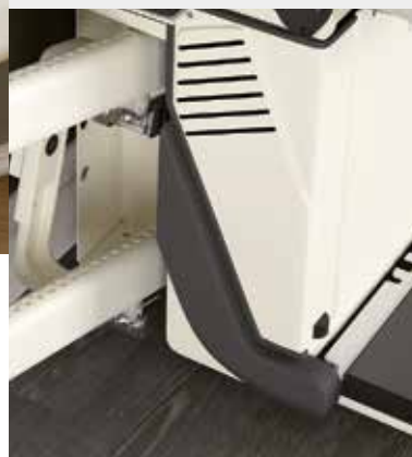
Le repose pieds et le corps de la machine sont dotés de capteurs sensoriels pour la complète sécurité en phase d'utilisation